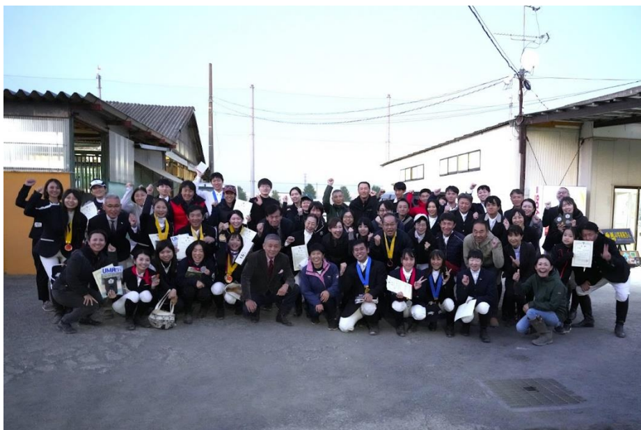
前回 オータムの集合写真